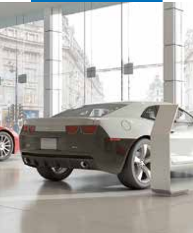
Dlažba položená s použitím Mapetex Systemu